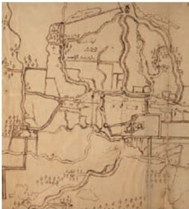
Deze tekening van Helmond van omstreeks 1600 is vermoedelijk getekend door een militaire landmeter die voor Prins Maurits de stad Helmond in beeld moest brengen, voordat in 1602 Prins Maurits met zijn legers door Helmond trok.

bij Astense Aa en bij het Goor, de groene gemeent, begint en nabij Beek met de Aa samenkomt.